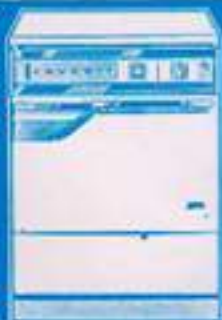
lavaplatos Favorit RF 31.980 pts.