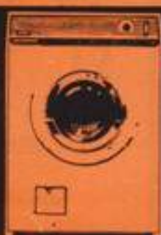
lavadora Claramat 16.180 pts.