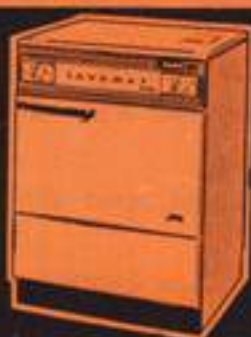
lavadora Bella 29.980 pts.