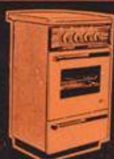
A gas Costa Verde 5.450 pts.