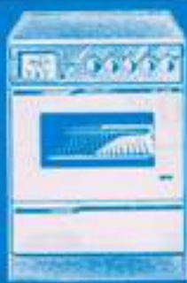
Cocina eléctrica DUF-4 19.850 pts.