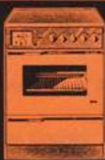
Cocina eléctrica DUF-4 19.850 pts.