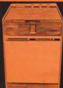
lavaplatos Favorit R 28.600 pts.