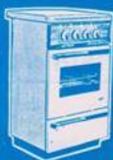
A gas Costa Verde 5.450 pts.