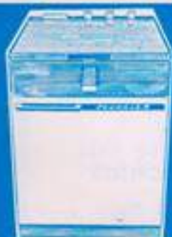
lavaplatos Favorit R 28.600 pts.