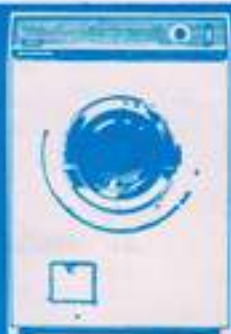
lavadora Claramat 16.180 pts.