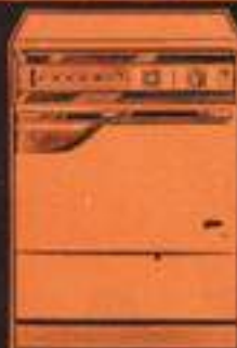
lavaplatos Favorit RF 31.980 pts.