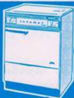
lavadora Bella 29.980 pts.