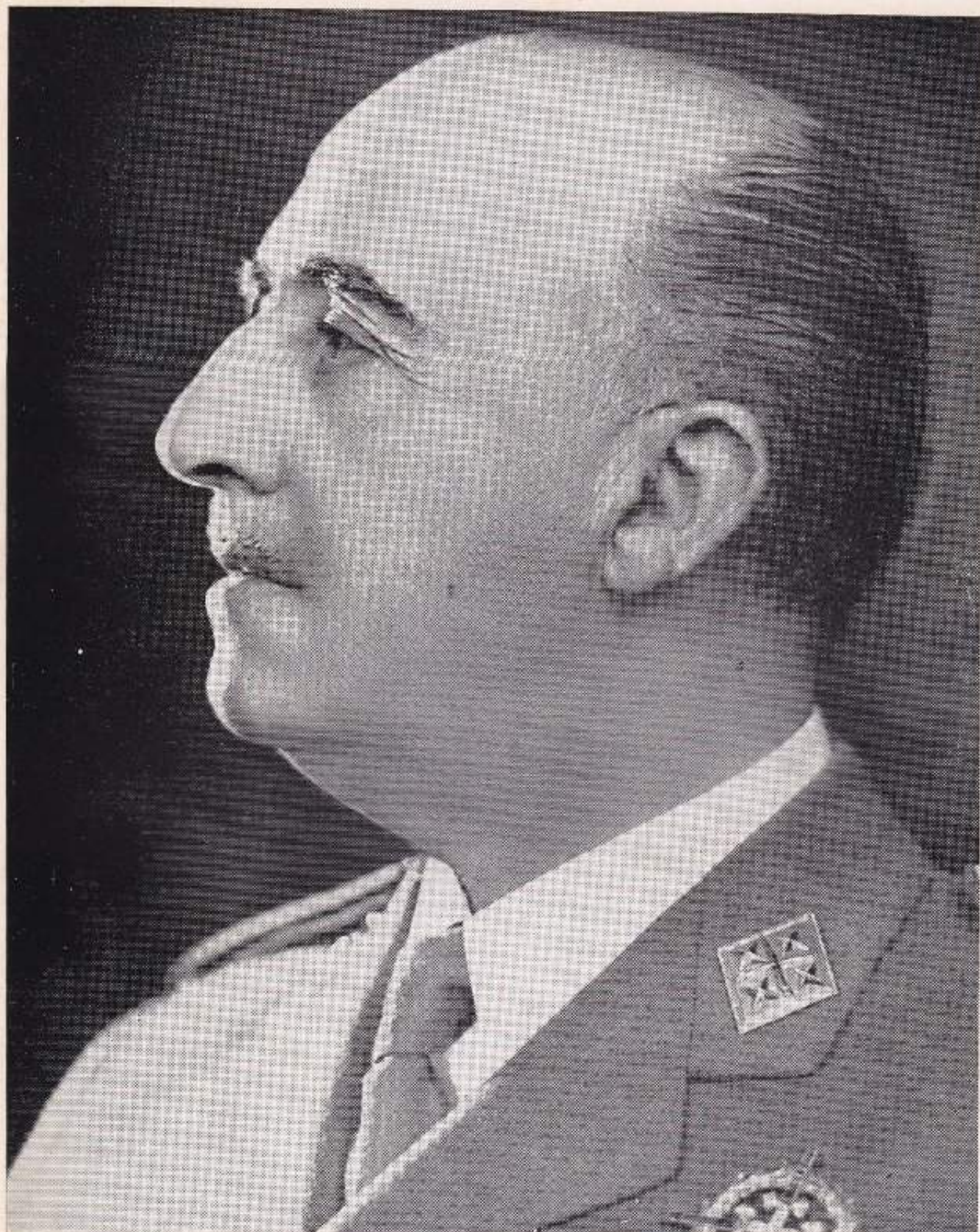
Excmo. Sr. D. Francisco Franco Bahamonde, artífice del bienestar y progreso de España