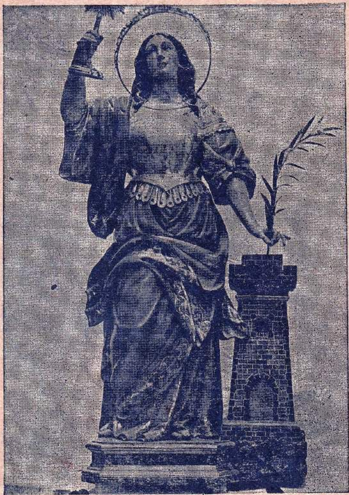
IMAGEN DE SANTA BARBARA

que se venera en la Iglesia Parroquial de Benifayó