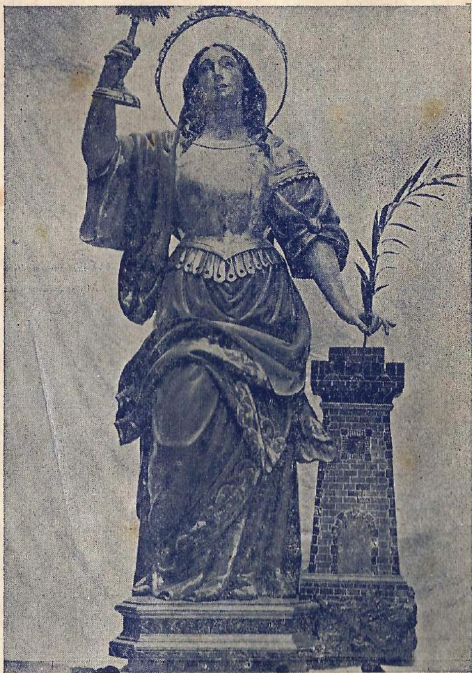
IMAGEN DE SANTA BARBARA que se venera en la Iglesia Parroquial de Benifayó